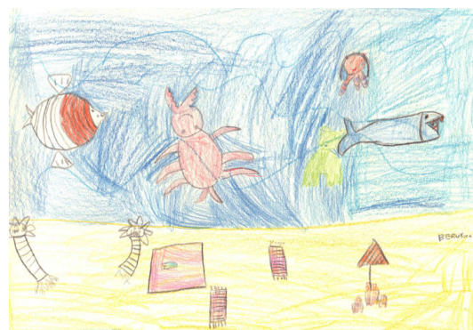
(Djevojčica, 5 godina : "More i život")

Na satovima glazbe djeca uče narodne pjesme i mnoge od tih pjesama govore o ljepoti i moći vode. Najmlađi uče tematski. Svaka tema traje 14 dana i pojavljuje se u različitim sadržajima. Tema o vodi za najmlađe pojavljuje se u uršulinskim školama u prvoj polovici mjeseca ožujka 2012. g. Jako se dobro uklapa u taj dio godine jer tada započinje proljeće. Djeca će crtati, pjevati, izražavati se, slušati priče ... Tijekom tih 14 dana kateheza će se usredotočiti na Isusova čudesa vezana uz vodu, vodeći ih prema krštenju gdje je voda simbol očišćenja i snage milosti Božje.